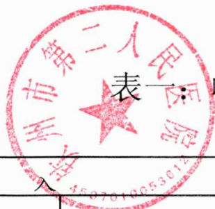
表一：收入支出决算总表