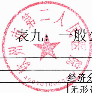
表九：一般公共预算财政拨款项目支出决算表