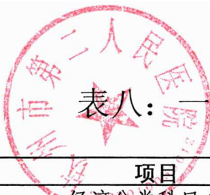
表八：一般公共预算财政拨款基本支出决算表