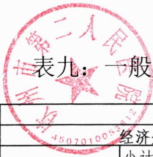
表九：一般公共预算财政拨款项目支出决算表