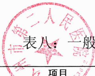
表八：一般公共预算财政拨款基本支出决算表