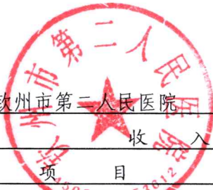
表一：收入支出决算总表