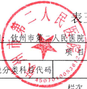
表五：一般公共预算财政拨款支出决算表